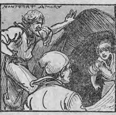
trada de la cueva en donde según la tradición estaba enterrado el tesoro de los piratas. Trabajaron febrilmente y pronto lograron desmenuar las piedras que cerraban la entrada.