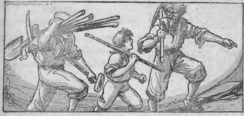
TRAS LA HUELLA Sin pérdida de tiempo siguieron el rastro del león. Llevaban los instrumentos con los cuales intentaban abrir la en-