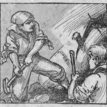
trada de la cueva en donde según la tradición estaba enterrado el tesoro de los piratas. Trabajaron febrilmente y pronto lograron desmenuar las piedras que cerraban la entrada.