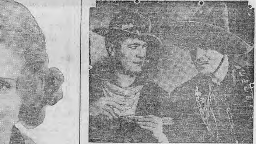
When Cavaliero meets Cavalryman! Warner Baxter, bandit love matches wit with his relentless army pursuer, Edmund Lowe in Fox Films' adventure drama, "The Cisco Kid."

EL CISCO KID la formidable creación "Fox" de aventuras de vaqueros con Warner Baxter y Conchita Montenegro que hoy se estrena en el Ravelotés. Para mañana "Ahora y Siempre" la creación gigantesca de la adorable chiquilla Shirley Temple